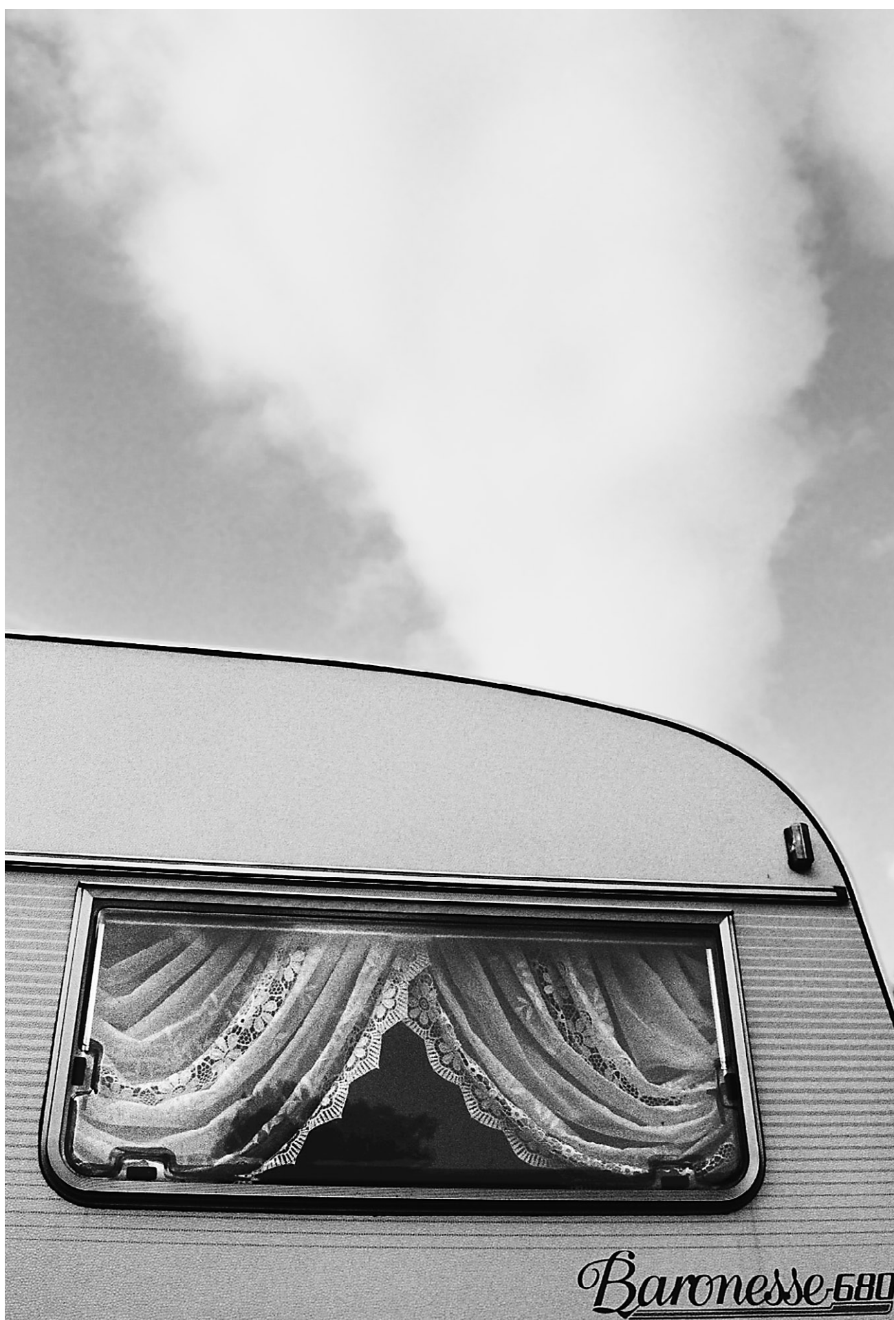
Fahrende auf einem Campingplatz: Mit «lustigem Zigeunerleben» hat die Realität wenig zu tun.