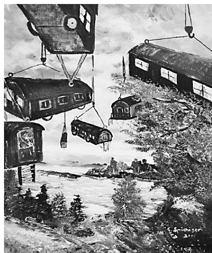
Luftplätze: Ein Gemälde von Ernst Spichiger.

der Fahrenden und zu den Anforderungen an Stand- und Durchgangsplätze. Es entwirft zudem eine gesamtschweizerische, dennoch regional differenzierte Sicht», schrieb die damalige Bundesrätin Ruth Dreifuss im Vorwort des Gutachtens. Rund zwei Jahre später reichte die Kommission des Nationalrates für soziale Sicherheit und Gesundheit auf Anregung der Stiftung ein Postulat für